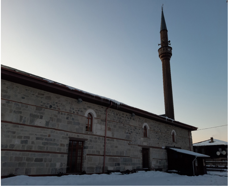
Dörtdivan, Çavuşlar Camii, nâm-ı diğer Baba Hızır Camii.

Çavuşlar Camii, 1780 senesine ait bir belgede Baba Hızır Camii olarak geçmektedir. Bu belgede camide hatip olarak görev yapan Mustafa oğlu Veli isimdeki şahsın evlatsız öldüğü bildirilmektedir. Hasan Halife isminde bir şahsın yazdığı bu arzuhalde hatipliğin kendisine verilmesi talep edilmektedir. Bunun üzerine bizzat devrin padişahı Sultan I. Abdülhamid Han tarafından belgenin üzerine kendi el yazısıyla “İzn-i hümayûnum olmuştur.” şeklinde bir kayıt düşürülmüştür. Bunun üzerine hatiplik Hasan Halife adındaki bu şahsa verilmiştir. 15