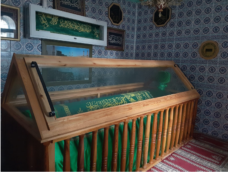
Mengen'de bulunan Baba Hızır hazretlerinin türbesinin içi ve sandukası

Baba Hızır'ın hem kendi ismi hem de türbesi etrafında zaman içinde bazı anlatıların ortaya çıktığı anlaşılmaktadır. Bu anlatılar, Bolu'nun farklı ilçelerinde bulunan türbeler etrafında gelişen anlatılarla da benzerlik göstermektedir.