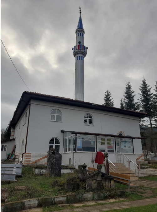
Mengen'deki Baba Hızır Camii

Hızır kültürü Anadolu'da çok derin izler bırakmıştır. Bu izlerin birçoğu halk anlatılarında hâlen takip edilebilmektedir. Birçok yerde Hıdırlık diye anılan yerlerin olması, Hızır Aleyhisselam'a atfedilen bazı makam ve türbeler, onun ismi etrafında oluşan kültür ve Hıdırellez de göstermektedir ki, Hızır kültürü, Türk kültürü içerisinde çok zengin bir muhtevaya sahiptir. Ancak bu mevzunun mahiyetini net bir şekilde anlamak, ona bir hudut çizmek çok zor gözükmektedir.