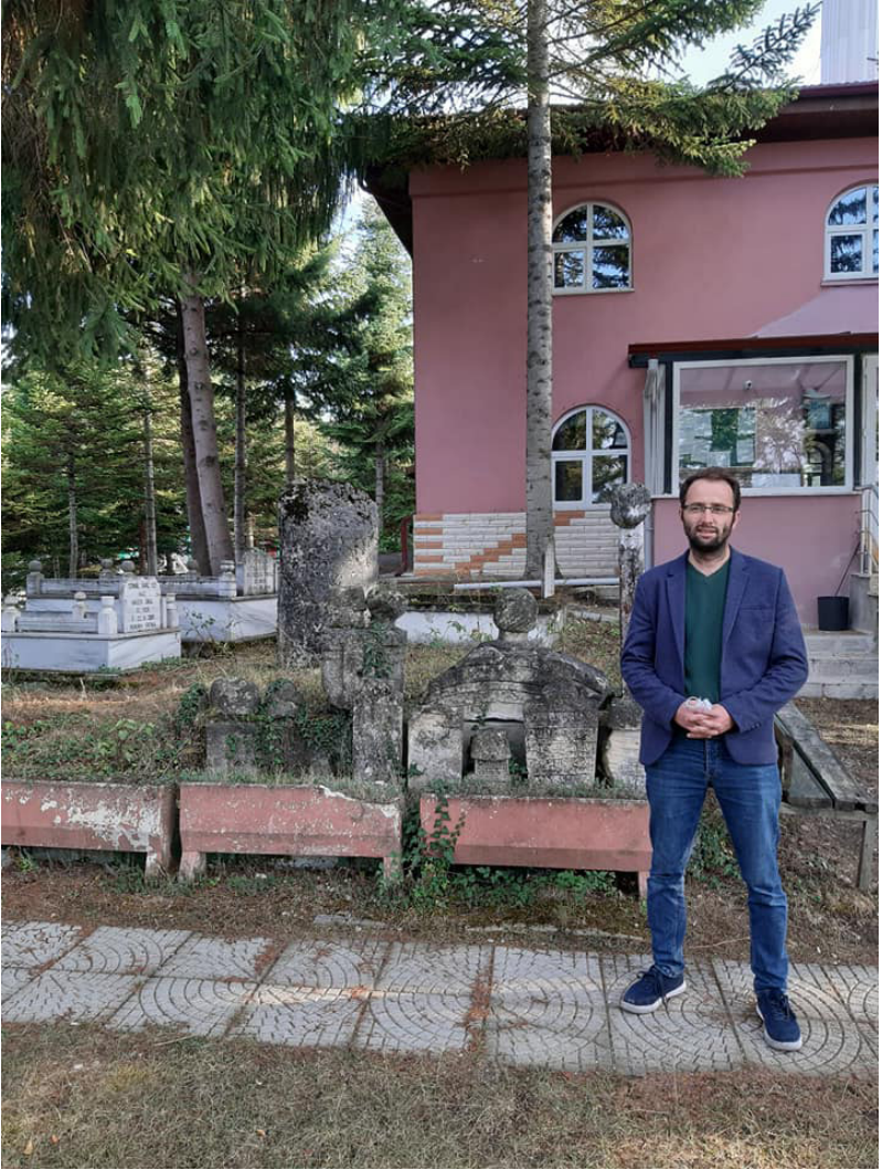
Mengen'in Bababızır köyündeki arařtırmalarımızdan bir kare. 2020