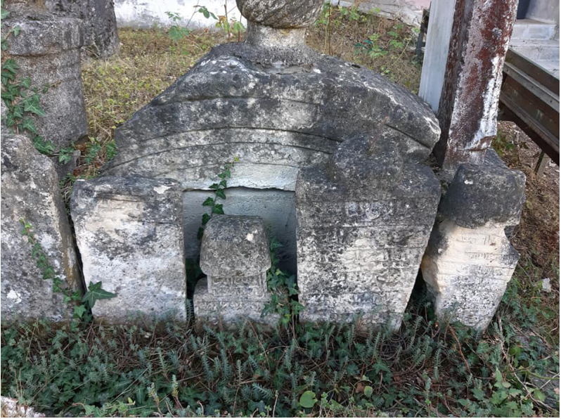
Mengen-Baba Hızır Camii haziresinden...