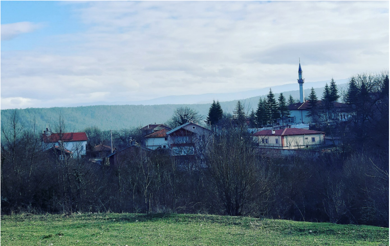
Mengen, Babahızır Köyü.