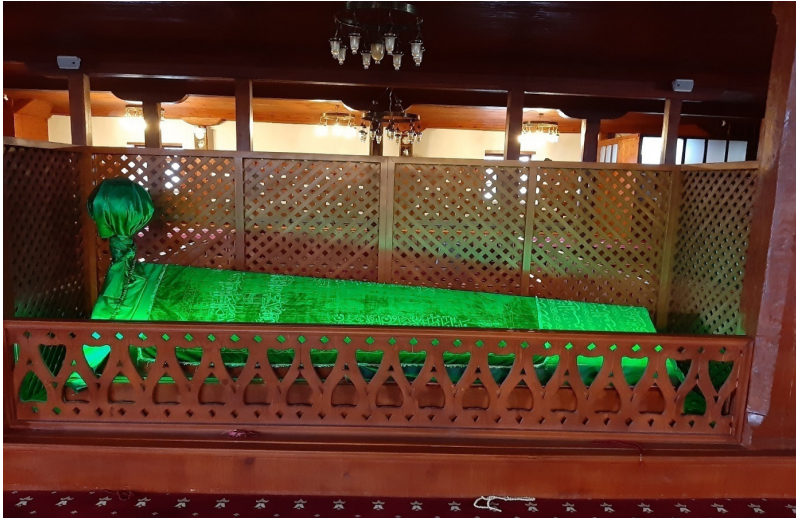
Dörtdivan, Çavuşlar Camii’nde bulunan yatır, bir Baba Hızır makamıdır.

Sonuç olarak Dörtdivan’da Baba Hızır’a atfedilen bir makam ve iki cami vardır. Burada Çavuşlar Camii içerisindeki kabrin Baba Hızır’a ait bir makam olduğunu söylemek mümkün görünmektedir. Ayrıca Çardak Köyü’ndeki cami de bir “Baba Hızır Camii” olarak anılabilir. Fakat burada bir zamanlar bir mezarın bulunup bulunmadığı tetkik edilmelidir. Kanaatimizce Baba Hızır ve Hızır-İlyas kültürüyle ilgili araştırmalarda Dörtdivan’da bulunan ve Baba Hızır’a atfedilen makam ve camilerin dikkate alınması gerekmektedir.