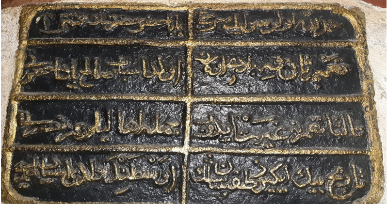
Çavuşlar Camii'nde Baba Hızır'ın adının geçtiği kitabe.

Çavuşlar Camii ile ilgili bir başka belgede caminin adı Alaca Mescid olarak kaydedilmiştir ve yine burada, Baba Hızır Medresesi'nden söz edilmektedir. Öyleyse caminin hemen yanında bugün hiçbir kalıntısı kalmamış bir Baba Hızır Medresesi'nin var olduğu da anlaşılmaktadır. Bu durumda cami, medrese ve Baba Hızır yakınlığı ortaya çıkmaktadır.